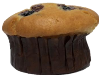
ลักษณะผิดปกติ หรือ รูปทรงเบี้ยว