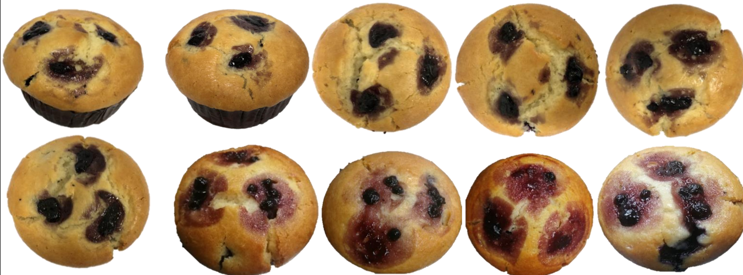
ลักษณะปกติ